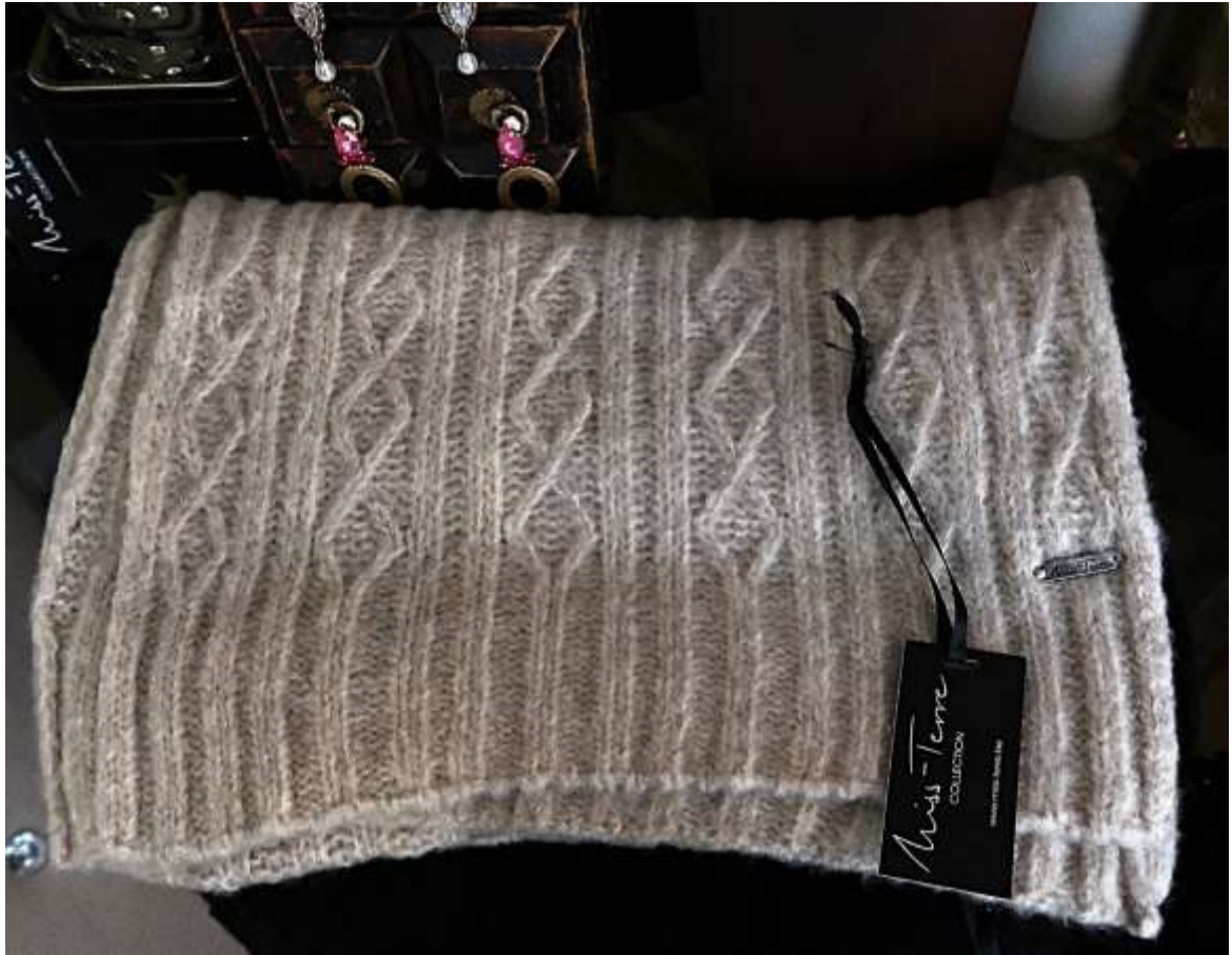
Grands carrés luxe à sequins de marque Miss Terre : 79 euros